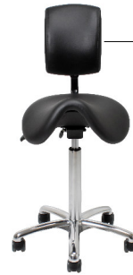
VELA Samba 400S

Das kleine Fußkreuz bietet viel Platz für die Beine