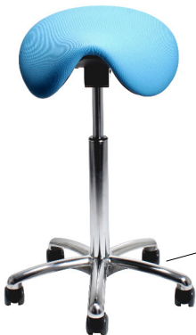
VELA Samba 400

Die einstellbare Sitzneigung ermöglicht eine aktive Sitzhaltung