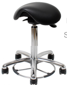
VELA Samba 400

Mit kurzem Sattelsitz und Sitzhöhenverstellung per Fußring