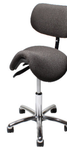
VELA Samba 400Y

Mit kurzem Sattelsitz und Sitzhöhenverstellung per Fußring