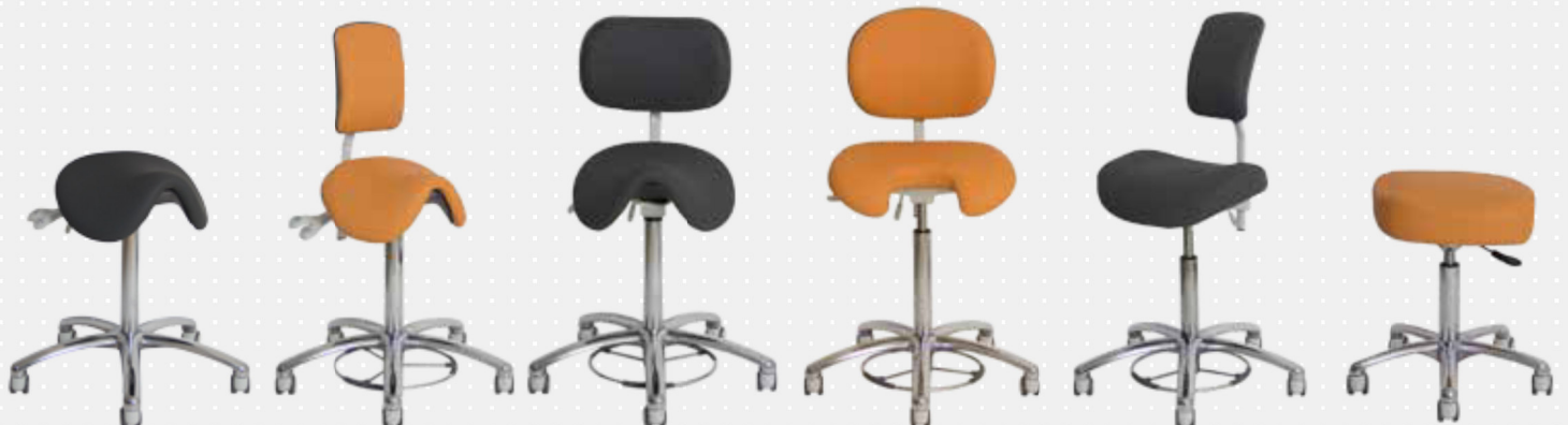
VELA Samba 400

VELA stattet seit den 1960ern Dental Praxen aus. Das ergonomische Design und die einfache Handhabung von Sitz, Rückenlehne, Armlehne und Zubehör tragen zu einer guten Arbeitsposition der Praxis und der Sicherheit des Patienten bei.